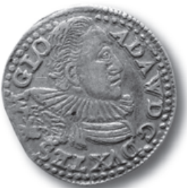
Avers třígroše těšínského knížete Adama Václava z r. 1597 získaného do sbírek MT v r. 2010