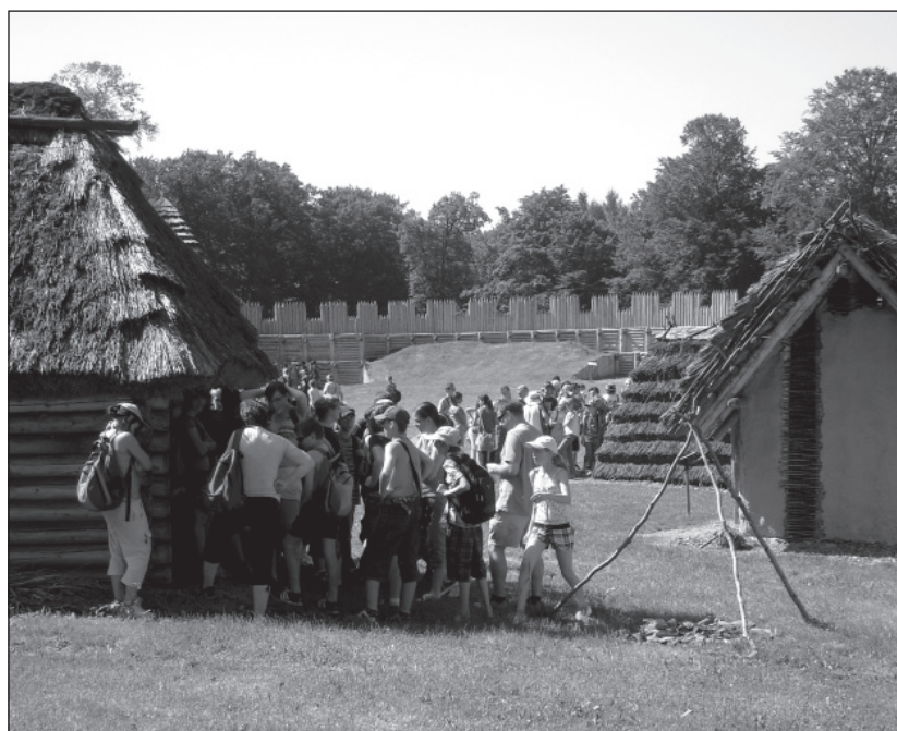
Školní exkurze v areálu Archeoparku v Chotěbuzi-Podoboře, 11. září 2011, foto Lenka Bichlerová

K zajímavým akcím pro veřejnost patřila v roce 2010 např. beseda o městě Orlová (návštěva 224 osob), přednášky o velkých šelmách v Jablunkově, Českém Těšíně a Havířově (247 osob), komentovaná prohlídka výstavy Mincovní platidla s ukázkou ražby mincí, slavnostní zahájení sezony v Archeoparku, přírodovědná vycházka Vítání ptačího zpěvu , noční prohlídka Archeoparku , tematická akce Vše nejlepší, Český Těšíne! uspořádaná k výročí vzniku města, pietní akt k výročí životické tragédie . Z tradičních akcí jmenujme také výtvarnou soutěž Jablunkovský džbánek (196 soutěžících), Velikonoce v muzeu (Musaion, 441 návštěvníků), Než začne advent (Musaion, 237 návštěvníků), Den řemesel (Kotulova dřevěnka, 651 návštěvníků), ukázka tradičního chovu domácích zvířat pro městské děti Máme rádi zvířátka (Kotulova dřevěnka, 369 osob), tradiční vánoční