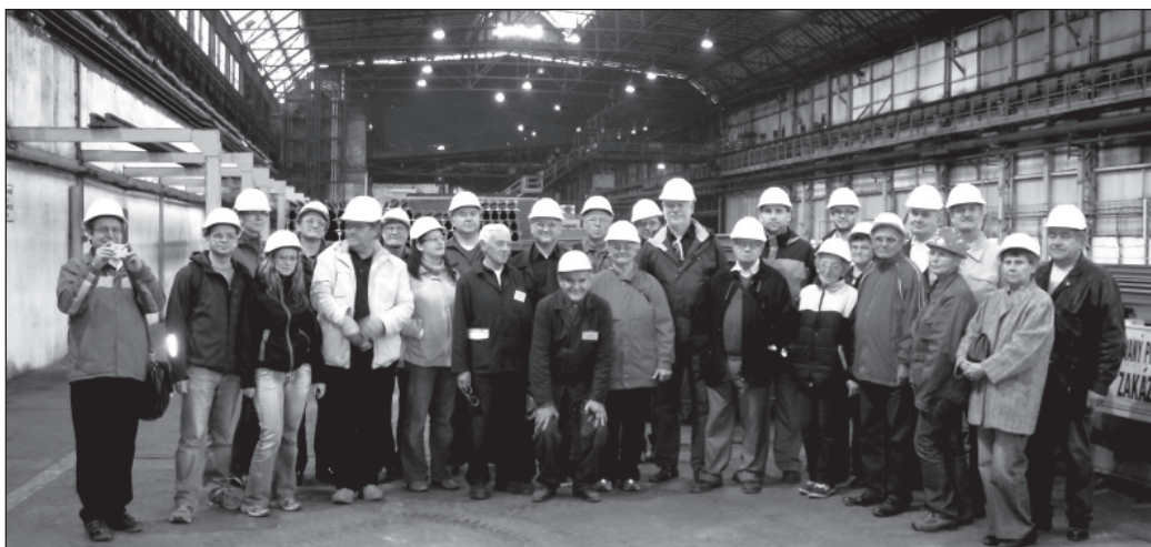
Jednou z nejúspěšnějších akcí Klubu Muzea Těšínska v loňském roce byla exkurze do Třineckých železáren, 7. října 2010