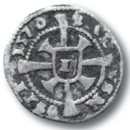
Avers krejcaru těšínského knížete Fridricha Kazimíra z r. 1570 získaného do sbírek MT v r. 2010