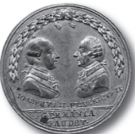
Avers pamětní medaile těšínského míru z r. 1779 získané do sbírek MT v r. 2010

věnované tomuto výročí. Následně byla zapůjčena Regionálnímu sdružení územní spolupráce Těšínského Slezska se sídlem v Českém Těšíně a je dlouhodobě prezentována v sídle Euroregionu Těšínské Slezsko.