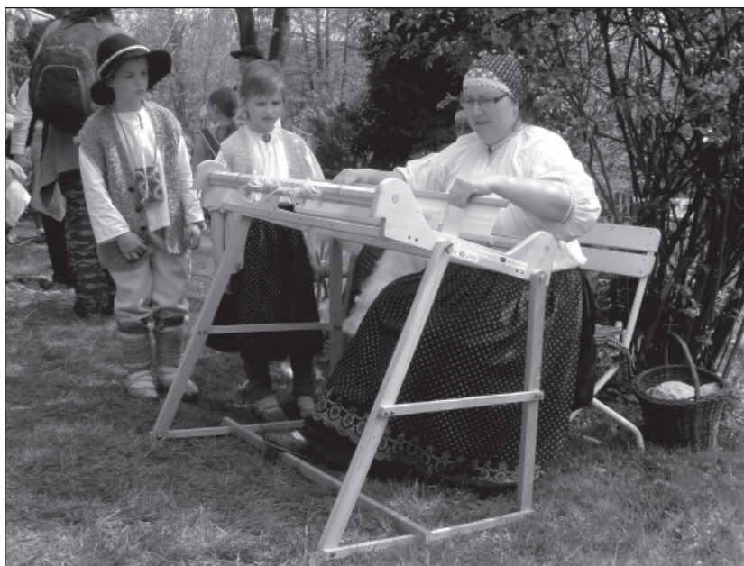
Den řemesel na Kotulově dřevěnce v Havířově-Bludovicích, 1. května 2010

posezení u stromečku (Karviná, 62 návštěvníků). V roce 2010 se v Karviné konal již 5. ročník našeho projektu Muzeum pro Karvinou , jenž zahrnoval vlastivědnou exkurzi formou autobusového zájezdu s názvem „ Poezie dřevěných kostelů “ (46 účastníků). Havířovská pobočka Musaion pokračuje v dlouholeté spolupráci s Klubem seniorů z Havířova, který nám dodal již 200 ks vlastnoručně vyrobených látkových panenek určených pro využití v muzejních programech s mateřskými školami nazvaných Panenky do postýlky . V loňském roce bylo připraveno ve všech pobočkách muzea celkem 197 doplňkových akcí .