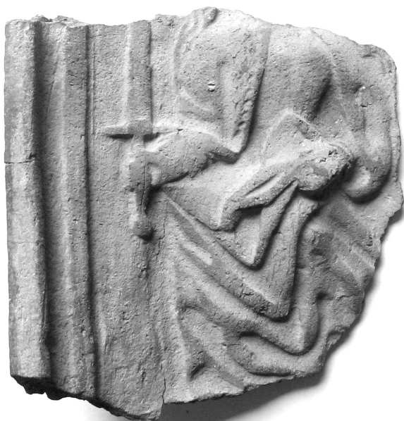
Fragment gotické kachle z 15. století nalezené při archeologických výzkumech v r. 1981 v Hrnčířské ulici v centru Karviné-Fryštátu. Postava držící v ruce meč nejspíše znázorňuje panovníka, neboť tento atribut byl odznakem důstojnosti, moci a vlády. Mohlo jít i o ztvárnění velitele andělského kúru archanděla Michaela, coby soudce nad dušemi všech zemřelých, či znakem městské exekutivní moci – rychtáře, na Těšínsku označovaného výrazem z němčiny – fojt.

Otázka nástupnictví po Zikmundovi Lucemburském se pro zemské obce Českého i Uherského království stávala s přibývajícím panovníkovým věkem stále naléhavější. Římskému králi se ze dvou manželství narodila jen jediná dcera, jejíž ruka tak zároveň otevírala cestu hned ke dvěma královským trůnům. Stále výraznější linií lucemburské politiky se proto stávala snaha stárnoucího panovníka o zajištění nástupnictví svému zeti Albrechtovi Habsburskému. Král už v roce 1423 svěřil do Albrechtových rukou správu Moravského markrabství a podobně usiloval o včasné upevnění jeho postavení v prostředí slezských knížectví. Krátce po zvolení panovníka z habsburského rodu v lednu roku 1438 se však část českých kališníků odmítla podřídit novému vladaři, nabídla proto českou korunu tehdy jedenáctiletému jagellonskému princovi Kazimírovi. Polskému králi se pro vidinu dalšího rozšíření rodové moci podařilo získat i značnou část domácí šlechty, a tak už v září roku 1438 překročila polská armáda hranice Horního Slezska. Připravené tažení se však zastavilo v blízkosti moravského pomezí. Do Čech dorazil