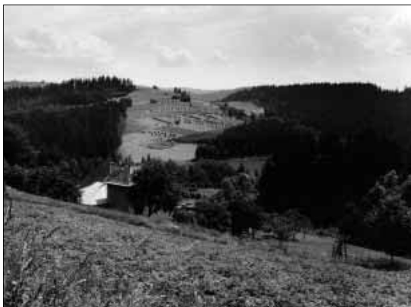
Celkový pohled na Hrčavu, 2001

I když 31. 5. 1926 vydala Zemská správní komise pro Slezsko se sídlem v Opavě vyjádření, že Hrčava nebude schopná samostatné existence, hlavně z hospodářských důvodů (markantní zvýšení daní), přesto si Hrčavané osamostatnění vymohli. To však sebou přineslo řadu problémů, především sporů o hranice se sousední obcí Bukovec. Obyvatelé místních osad Bařiny, Gavlonky, Gruně aj. nechtěli být připojeni k Hrčavě, a naopak Bukovečtí zase tyto osady odmítali proto, že by znamenaly „jazykový“ zářez do struktury obce. 41 osadníků se totiž hlásilo k české národnosti, oproti „pouhým“ 34 Polákům. 7 V Bukovci se k roku 1921 k české národnosti přihlásilo jen 52 obyvatel, k polské 960. 8