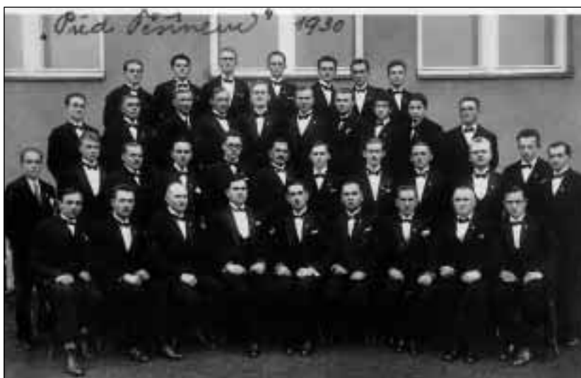
Mužský pěvecký sbor Před Těšínem v roce 1930, po přestěhování svého sídla do Orlové.