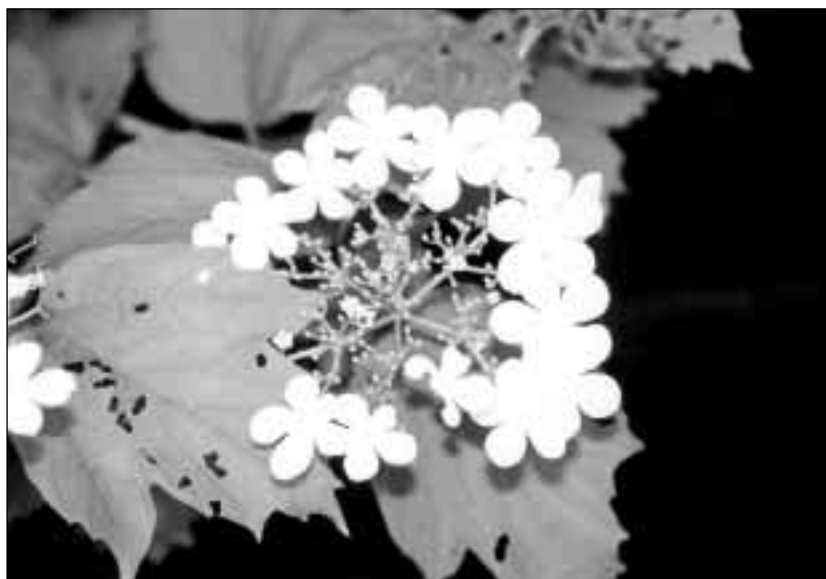
Kalina obecná

vrba nachová ( Salix purpurea ) a vrba trojmužná ( Salix triandra ).