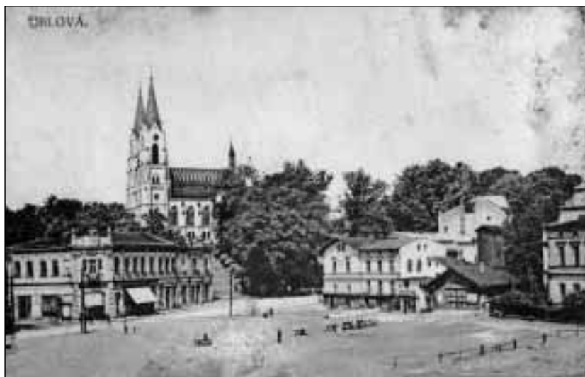
Orlovské náměstí v roce 1921. Na rohu náměstí ještě starý Kaniův hostinec, zcela vpravo část pseudorenezančního štítu staré radnice.