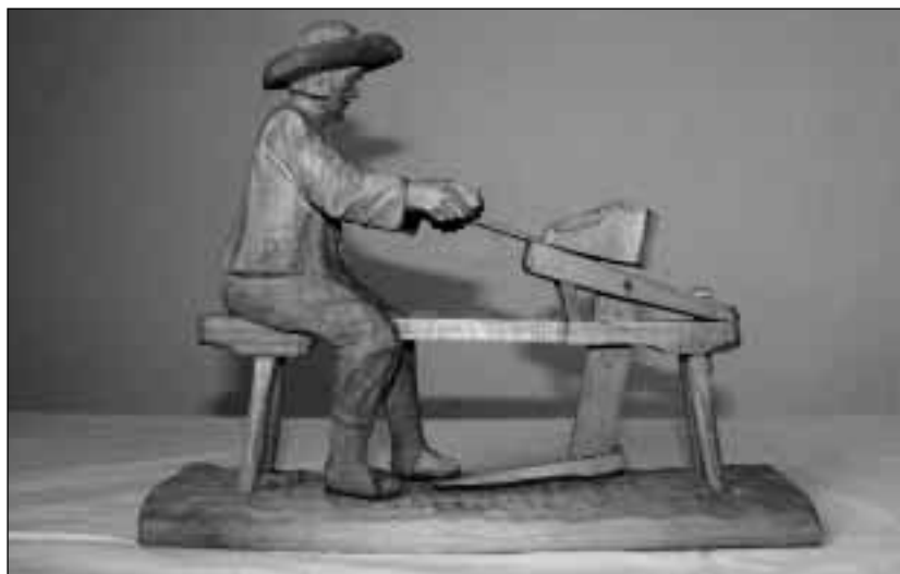
Výroba šindelů, dřevořezba, inv. č. 4002, Ondřej Zogata, 1956

O období 2. světové války nemáme informace o způsobu obživy obyvatel. Dá se předpokládat, že se příliš nezměnil, snad jen v důsledku lístkového systému.