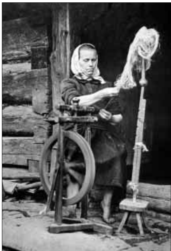
Předení na kolovrátku, foto: Karel Kaleta