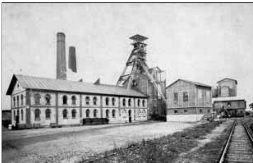
Hlavní jáma v Orlové ve 20. letech.