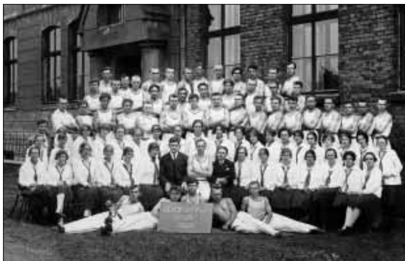
Tělocvičná sekce místní skupiny polské organizace Sita v Orlové v roce 1927.

Orlová nabízela permanentně obyvatelstvu města i okolí kulturní pořady, akademie, výstavy, pěvecká vystoupení a koncerty, výlety do přírody, divadelní představení, každoročně pak majálesy, dožínky, plesy, předvánoční besídky a programy. Na ochotnické divadlo byly zaměřeny divadelní soubory tělovýchovných organizací Sokol, Orel, dělnických tělocvičných jednot, dobrovolných hasičských sborů, od roku 1932 též spolku divadelních ochotníků Klicpera. Široko v regionu byl znám mužský pěvecký sbor Před Těšínem, od roku 1929 sídlící v Orlové, a orlovské Slezské kvarteto. Rozvoj kinematografie podmiňoval existenci