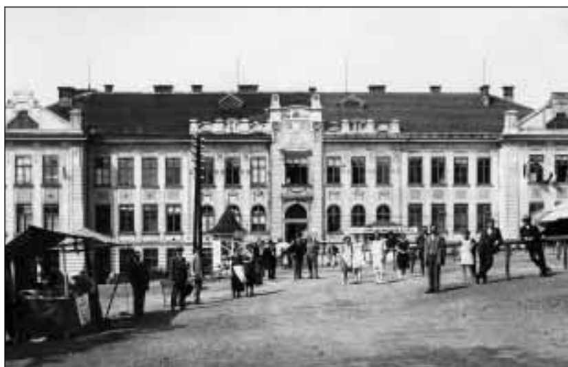
České gymnázium po dokončení pravé poloviny v roce 1926. V budově a před ní byla umístěna část orlovské výstavy.

Prosperovala firma Dřevoprůmysl M. Kabátka v Orlové, nábytková firma Majzlík a Bíbr v Orlové, několik firem vyrábějících likéry a řada výrobně opravárenských dílen, schopných pokrýt daný stupeň rozvinutosti potřeb obyvatel města. Velkou příležitostí k prezentaci orlovských podnikatelů se stala jejich účast na Průmyslové, živnostenské, obchodní a hospodářské výstavě Těšínska a Ostravska v Orlové v roce 1926 a další léta intenzitu podnikatelských aktivit v městě potvrdila.