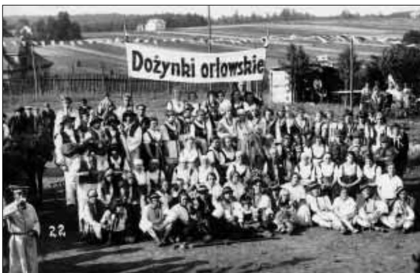
Orlovské dožínky z druhé poloviny 20. let, připravené organizacemi Macierz szkolna, Siła a Rodzina opiekuńcza.