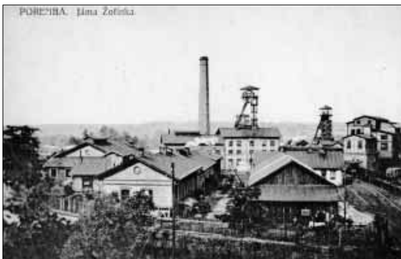
Důl Žofie v Porubě u Orlové v meziválečném období.