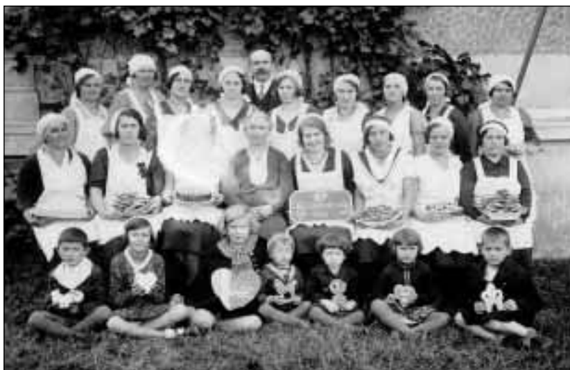
Kurz medového pečiva, organizovaný zájmovou organizací včelařů v Lazích u Orlové v roce 1933.

Složité byl vývoj politických poměrů v měs- tě. V rámci pluralitního politického systému první ČSR zahrnovaly kandidátní listiny do