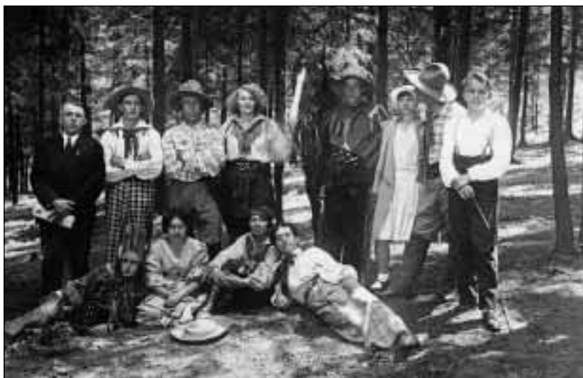
Divadelní ochotnický soubor Maják při představení v přírodním prostředí „Holotovce“. Snímek z první republiky.