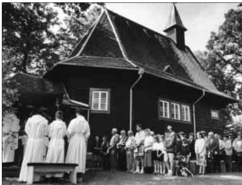
Poutí na sv. Cyrila a Metoděje na Hřčavě, 2001