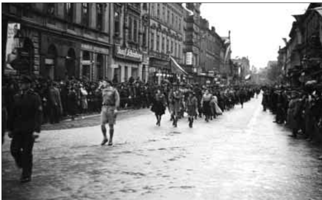
Průvod skautů v Českém Těšíně, 28. října 1935, v čele O. Štěrba

Vírou živou rozumím víru ve skutky. Člověk potřebuje, aby byl složen ze 100% víry a 100% skutků, ač se to zdá absurdním. Nikoliv polovičatost – 50 % a 50 %, nýbrž úplně a nerozdílně, jak řekl kterýsi básník o víře a vlasti: „Každá má srdce mého půl, každá má srdce mé celé.”