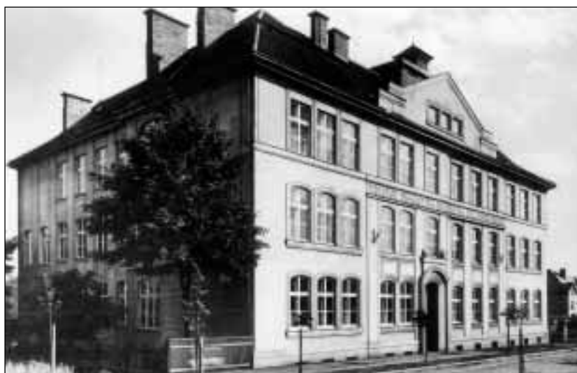
Polské gymnázium v Orlové po dobudování v roce 1927. Snímek z 30. let.