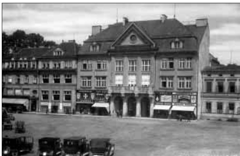
Průčelí nové orlovské radnice z roku 1928, vpravo dívčí obecná škola. Snímek z 30. let.