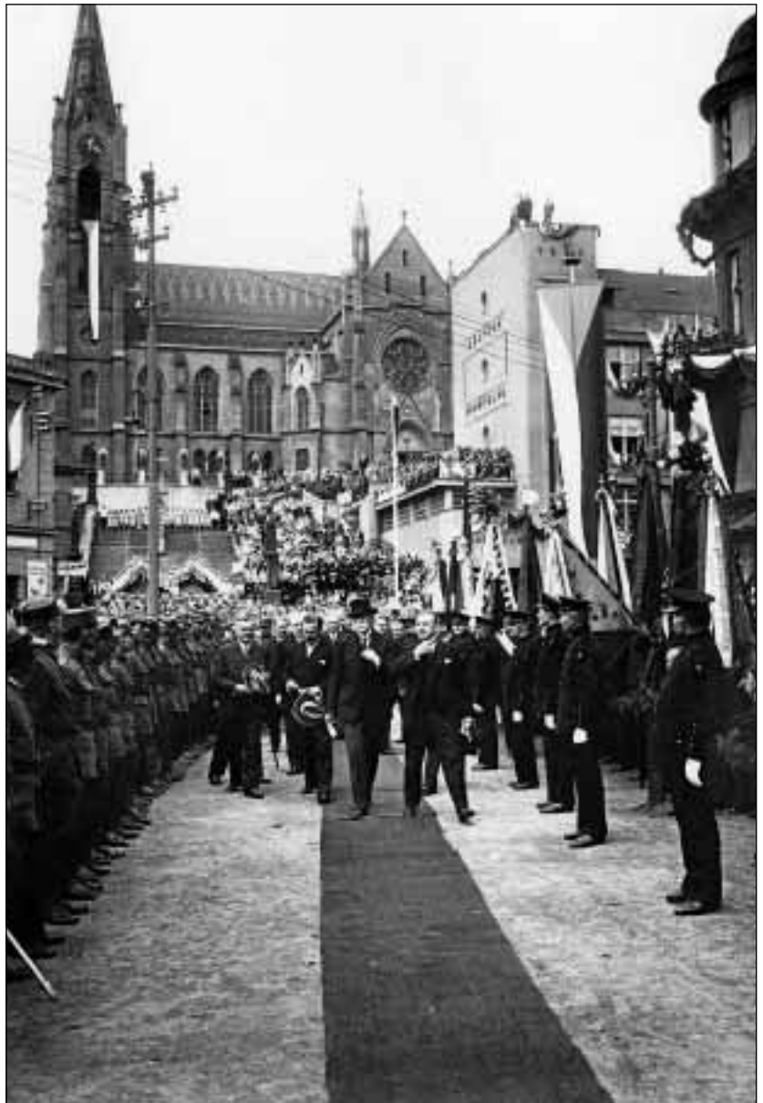
Prezident republiky T. G. Masaryk v Orlové 6. července 1930.

Už v roce 1994 jsem přinesl v časopise Těšínsko poměrně zevrubný obraz obchodní sítě, která lemovala orlovské náměstí, hlavní ulici,