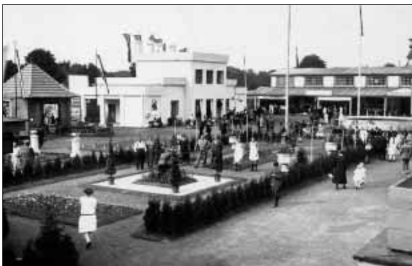
Vstupní nádvoří orlovského výstaviště z roku 1926.