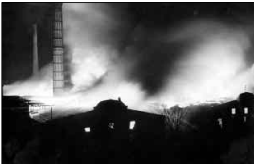
Noční požár orlovské cihelny 28. dubna 1938.