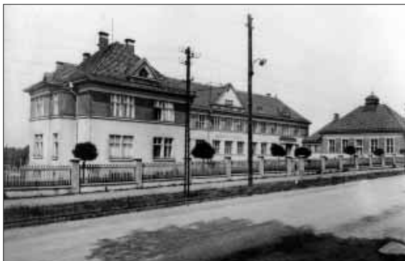
Česká měšťanská škola v Orlové – na Kopaninách, postavená v roce 1926