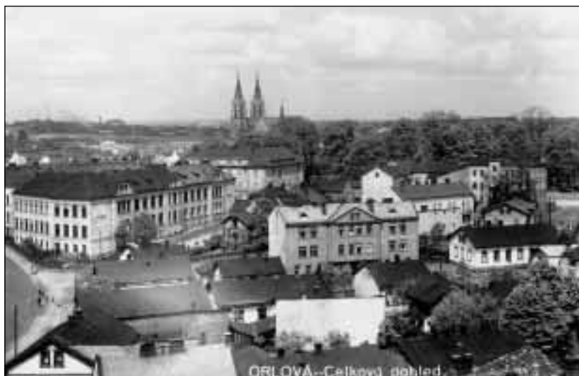
Celkový pohled na střed Orlové v roce 1937. Vlevo v popředí česká měšťanská škola.

V Orlové a okolí existovaly a zejména v druhé polovině 20. let se úspěšně rozvíjely též některé jiné průmyslové či řemeslné podniky. Patřila nim Orlovská strojírna, slévárna železa a kovů, v majetku místních společníků, a strojírenská firma Josef Kristl, obě v Porubě, elektrotechnická firma Glacner v Orlové, Elektroferra v Orlové, cihelny, některé ve vlastnictví těžářstev, jiné v majetku místních obyvatel.