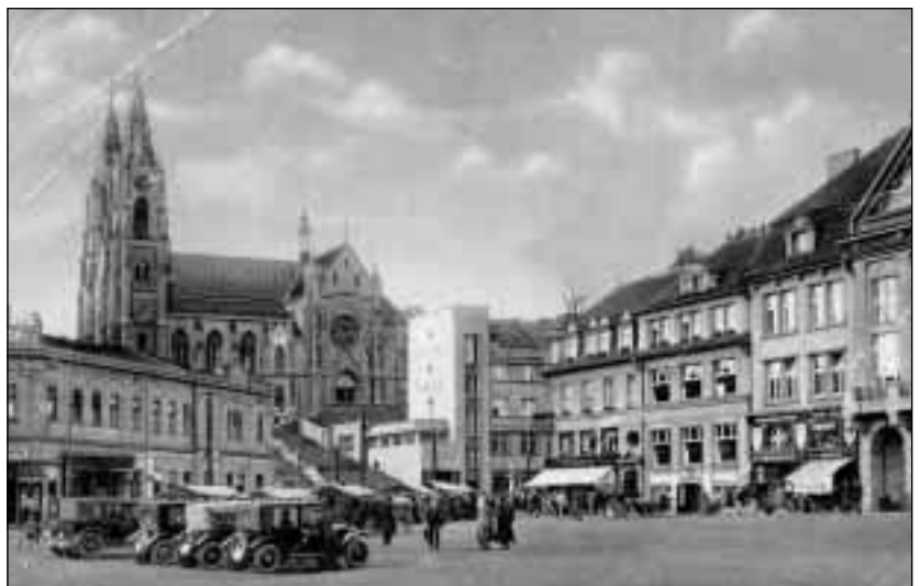
Náměstí v Orlové v 30. letech. Na rohu náměstí už obchodní dům A. Chamrad z roku 1926, pod kostelem budova spořitelny z roku 1927. Vpravo část budovy nové radnice.