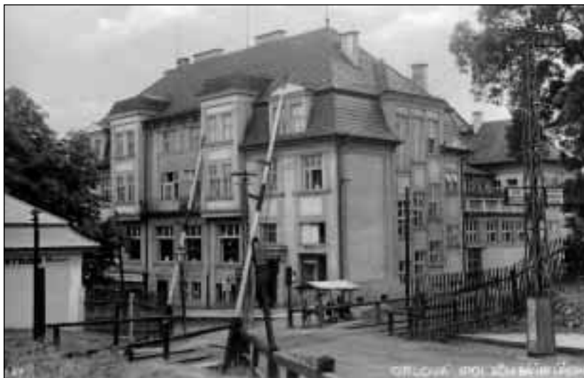
Báňský dům pod „horními“ závorami v Orlové z roku 1925.

Skromné přízemní domky hornických kolonií z 19. a počátku 20. století byly stále obydleny, poměrně nejhůře byla poznamenána tokem času kolonie Mizam. Za první republiky přibýly nebo se dobudovaly ještě některé hornické osady rozsahem už nevelké, ale stavěné moderněji, nejednou v podobě 1-2 patrových domů – na Olšovci, Pod lipou, na Kopaninách, v Zimném dole, vesměs v první polovině 20. let. Pak se stav stabilizoval a výstavba pokračovala na dosud nezastavěných parcelách spíše v podobě rodinných „vilek“, stavěných s větším zřetelem na hezký vzhled a originalitu projektů. Všech domů bylo v Orlové v roce 1869 174, v roce 1880 už 245, do roku 1921 jejich počet stoupl na 744 a v roce 1930 dosáhl čísla 879. 5