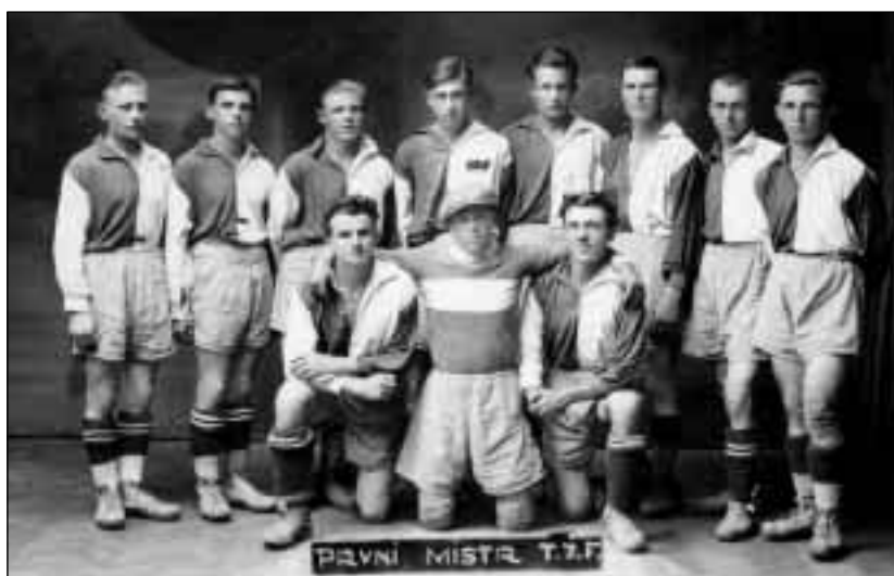
Fotbalisté sportovního klubu Meteor Orlová, prvního mistra Těšínské župy fotbalové z první republiky.