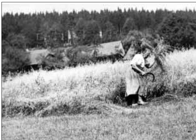
Žatí obilí srpem

Obecní zastupitelstvo přijalo návrh na zřízení kaple a hřbitova 16. 3. 1935. Ministrovi zemědělství byla poslána žádost o dar dřeva na stavbu, což bylo splněno. Dále bylo dohodnuto, že se bohoslužby budou konat v českém jazyce, a že kaple bude zasvěcena Cyrilu a Metodějovi. 56 1. 12. 1935 navštívil Hřčavu okresní jednatel SMOLu Karel Smyczek se zdejším