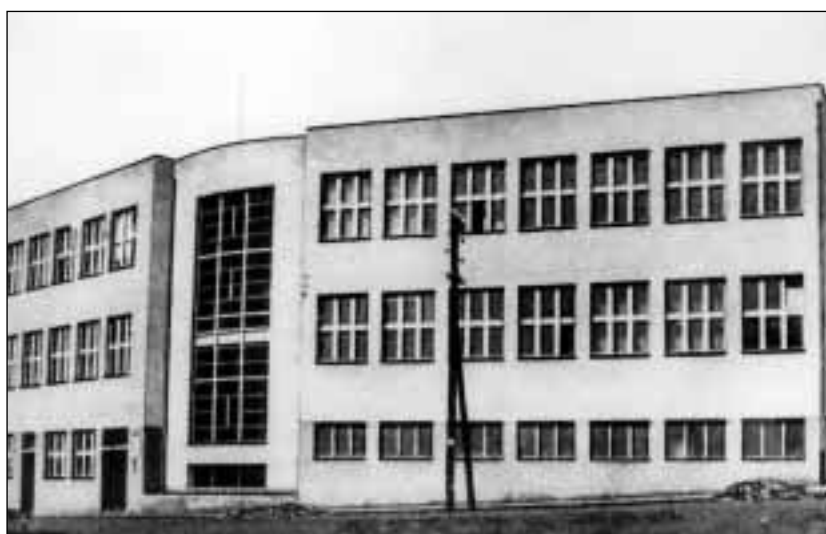
Nový objekt obchodní akademie v Orlové v roce 1937 (před dokončením).