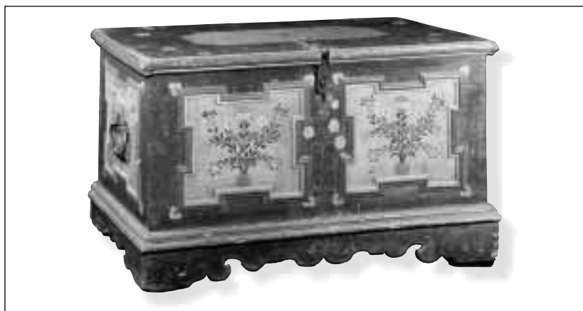
Truhla z roku 1795, okolí Těšína. Jedna z nejstarších a nejlépe zachovaných truhel je opatřena dřevěnými kolečky, která sloužila k jejímu přemístování. Velmi dobře patrná je malba na víku a prkenném podstavci. Dekor na přední části i bocích je zvýrazněn barokně lomeným lištovým rámem.

Při komponování dekoru truhly byl hlavní důraz kladen na čelní stěnu. Zde se objevuje datování, texty nebo iniciály. Dekor víka a bočních stěn svou barevností sice navazuje na dekor čela, avšak zřídka se opakuje. U naprosté většiny truhel je čelo rozděleno do dvou čtvercových nebo obdélníkových ploch, ve kterých je rozveden hlavní dekor. Toto rozdělení dekoru je pro Těšínsko typické a v mnoha případech odlišuje těšínské truhly od truhel z jiných regionů. Obdélníkové a čtvercové plochy jsou lemované zpravidla dvojitou barevnou linkou, méně často barevně odlišnou profilovanou lištou, někdy barokně zalamovanou. Pozadí těchto ploch je barevně odlišné od základního nátěru truhly. Charakteristický pro Těšínsko (i když méně častý) je také centrální symetrický motiv, který je buď rozveden po celé ploše čela, nebo v poli ohraničeném zalamovanými lištami. Základní motiv malby tvoří kytice květů ve vázách, džbánkách, květináčích nebo jen svázaných mašlí. Kytice květů jsou někdy doplněny vyobrazením párů ptáčků. Ptáček s klíčem v zobáčku bývá občas zobrazen pod datací nebo klíčovou dírkou. V jediném případě se motiv ptáčka objevuje také na víku. Způsob dekorace víka je různorodý