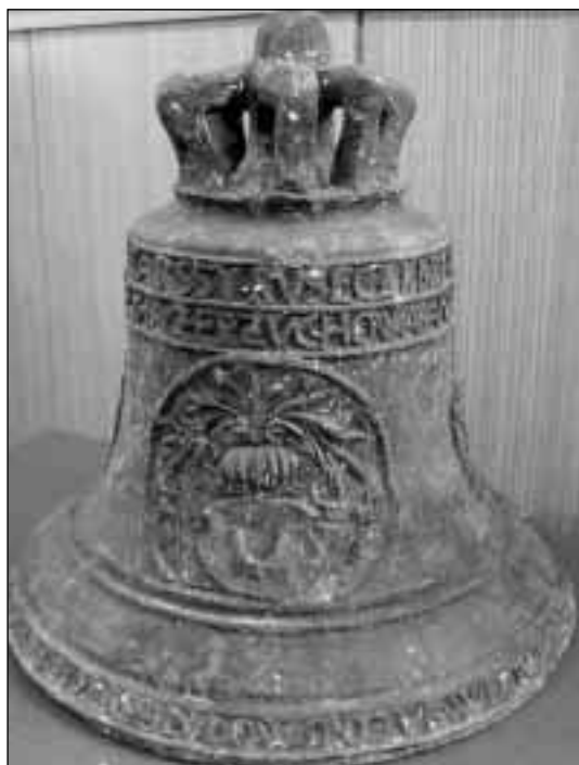
Erb Šelihů z Řuchova