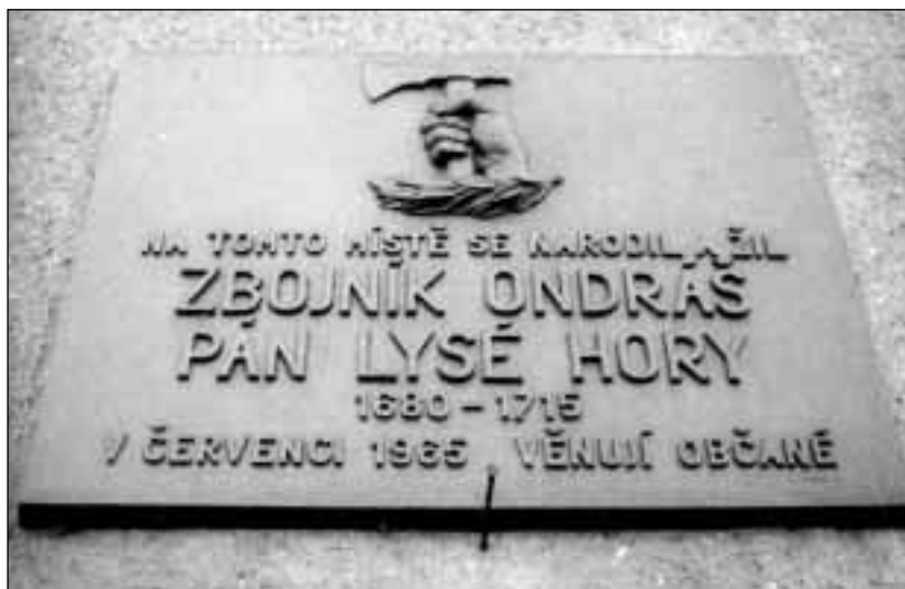
Janovice, pamětní deska na fojství

hory – žila svůj život odlišný od skutečnosti. Ze všech vybájených zbojnických činů Ondráše se zvláště houževnatě udržuje ta o první jeho krádeži spáchané v r. 1677 na vlastním otci odcizením kontribuce, kterou otec nesl do Frýdku, a jako důkaz se uvádí vzrůst zatížení statku na 101 zl. Soudím, že neběželo o zvýšení zatížení, nýbrž o poznamenání kontribuce na fojství vázané. Tak vysoká berně byla ve 2. polovině 17. století velmi častá u privilegovaných statků; kupř. 100 zl. platil fojt Sedlišť a Bašky, 90 zl. fojt Vyšních Lhot a stejně vysoké byly berně u řady volných sedláků. Proto nebudí nijakou pozornost, že u prodeje fojství z otce Ondry na syna Jana v r. 1709 za 400 zl. se uvádí, že tato cena sestává ze 138 zl. sirotčích peněz a 261 zl. otcova dluhu včetně kontribuce 101 zl. Konečně – je velmi pochybné, že by Ondráš ve svých 16-17 letech byl schopen oloupit vlastního otce. Mně se zajímavější jeví skutečnost, že otec fojt nebyl nijak viditelně postižen tím, že jeho prvorozený syn a nástupce ve funkci fojta se postavil mimo zákon, neboť vykonával své rychtářské povinnosti až do r. 1709, kdy Ondráš měl už 29 let.