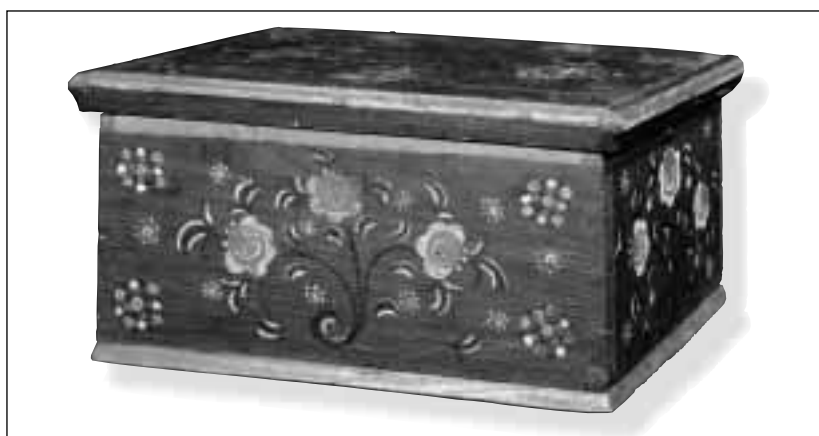
Truhlička z Milíkova. Sloužila k uchovávání cenností a drobných věcí. Její dekor napodobuje výzdobu velkých oděvních truhel.