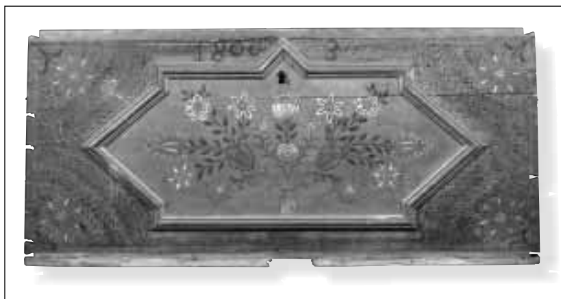
Přední část truhly z roku 1800, Dolní Lištná. Základní náteř fládrováný, dekor je soustředěn do jediné středové plochy, lemované barokně lomenou lištou.