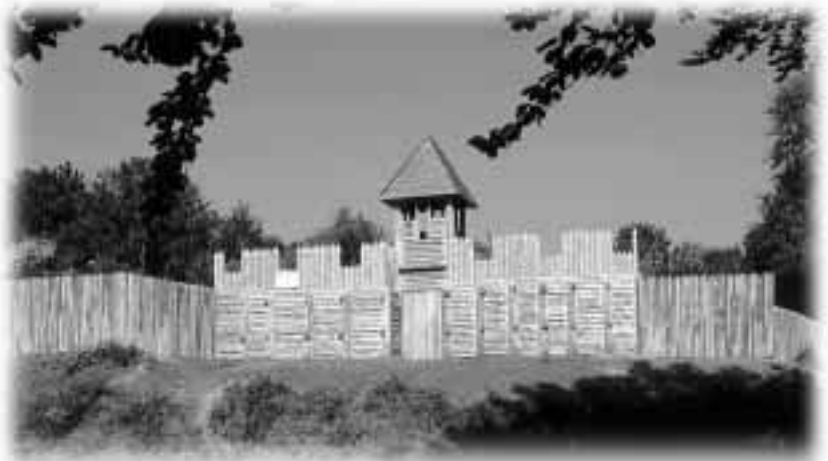
Brána s částí hradby

Jednou z nejcennějších a nejzajímavějších lokalit na území Těšínského Slezska je bikulturní výšinné hradiště v Chotěbuzi – Podobore u Českého Těšína. Nejstarší osídlení na hradiště je spjato s obdobím pozdní doby bronzové a doby halštatské, kdy na místě pozdějšího skvěle ohrazeného slovanského hradiště vznikla neopevňovaná či jen lehce chráněná osada, která se postupně změnila ve fortifikovaný útvar. Někdy v průběhu 5. století př. n. l. byla tato osada dobyta a vypálena a z této katastrofy se již nikdy nevzpamatovala. Po přibližně dvanácti stoletích bylo toto příhodně vybrané místo znovu osídleno a dobudováno našimi předky – Slovany. Hradiště ve slovanském období bylo trojdílné a sestávalo se z akropole a dvou předhradí. Slovanské osídlení na hradiště můžeme rozdělit do dvou fází – starší je kladena přibližně do období od poloviny 8. století do přelomu 9. a 10. století; druhá, mladší fáze, začíná v průběhu 2. poloviny 10. století a končí někdy před polovinou 11. století. Je to doloženo i nálezem stříbrného denáru uherského krále Štěpána (997-1038) v zánikovém horizontu.