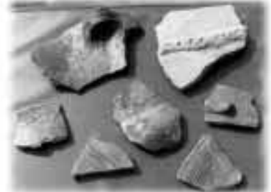
Z archeologických vykopávek, 2002

První zmínka o lokalitě pochází z 80. let 18. století (Schröder, 1887). Nejstarší výkopy a sběry tu byly prováděny již před 1. světovou válkou. Hradiště bylo stručně popsáno, celkem správně zařazeno do slovanského období a ztotožněno se Starým Těšínem (Popiołek, 1913-16, 1950, 1958; V. Karger 1917, 1922, 1941). Získaný archeologický materiál byl ukládán v muzeu v Cieszyně. Ve 2. polovině 30. let zde sondoval lesní inženýr Němec W. Rosenfeld z Frýdku-Místku, nálezy z jeho dílem i z předchozích výzkumů se dostaly z valné většiny opět do muzeí v Cieszyně a částečně i ve Wodzisławu Śl., kde jsou uloženy dodnes. V meziválečném období navštívil lokalitu společně s těšínským a opavským badatelem V. Kargerem i polský archeolog J. Żurowski a později v padesátých letech minulého století zde sondoval archeolog L. Jisl. Od roku 1978 vede výzkum doc. PhDr. Pavel Kouřil, CSc., ředitel Archeologického ústavu AV ČR v Brně.