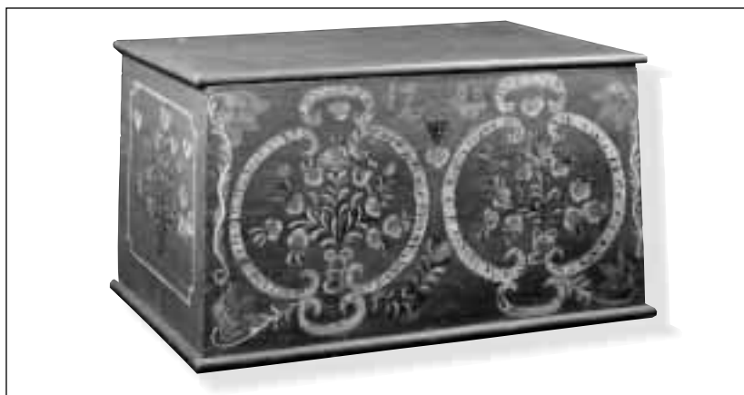
Truhla z roku 1700, Bukovec. Při náročném restaurování této nejstarší truhly ve sbírkách Muzea Těšínska byla obnovena malba a rekonstruováno víko. Podstavec truhly se nezachoval. Pod datováním na přední stěně jsou zobrazeni ptáčci – velmi častý zoomorfní motiv na těšínském malovaném nábytku.