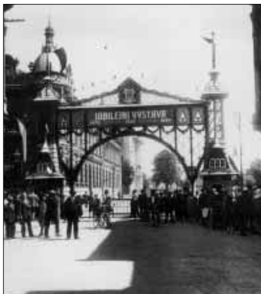
Místecká výstava 1926

dokazujeme nepřetržitou 600letou příslušnost Těšínska ke Koruně české.“