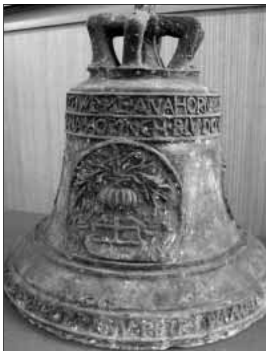
Erb Foglarů ze Studené Vody

Dětmarovic, Markłowice Dolne, Górne, severovýchodně od Wodzisławi), druhá z nich je zcela odlišná od námi dříve uvedených Marklovic, ležících severně od Karviné. Jednotlivě známe celou řadu Foglarů na Těšínsku, které však lze jen obtížně zařadit do spolehlivého rodokmenu. Přesto se pokusíme o jeho rekonstrukci: