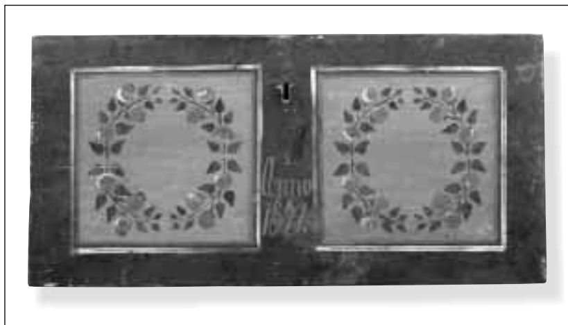
Přední část truhly z roku 1871. Motiv věnců se na čelní stěně objevuje zřídka, mnohem častěji se používal k výzdobě bočních stěn.

Lidové truhly jsou zřejmě nejzajímavějším druhem lidového nábytku, majícího své kořeny v měšťanském prostředí. Předchůdcem malovaných truhel byl úschovný nábytek ve formě dlabaných a kadlubových truhel, známých již od 11. a 12. století a sarkofágových truhel objevujících se od 16. století. V 17. a 18. století se truhla stává