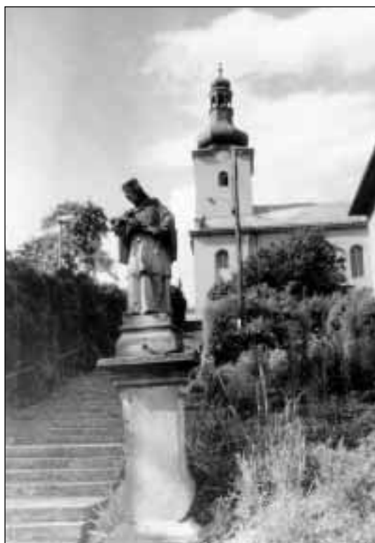
Bruzovice, kostel sv. Stanislava

Ves Dobrá, původně – ještě v r. 1664 – zvaná Dobrá Zemice, byla založena pravděpodobně v první vlně kolonizace jako Bruzovice a Sedliště. V r. 1580 měla 29 osedlých, v r. 1636 23 sedláků, 6 zahradníků a 4 chalupníky, v r. 1664 22 sedláků, 9 zahradníků a 16 chalupníků, v r. 1770 11 sedláků (vč. fojta), 16 zahradníků (vč. 2 mlynářů) a 80 chalupníků (v tom vysoký počet 9 volných). 16