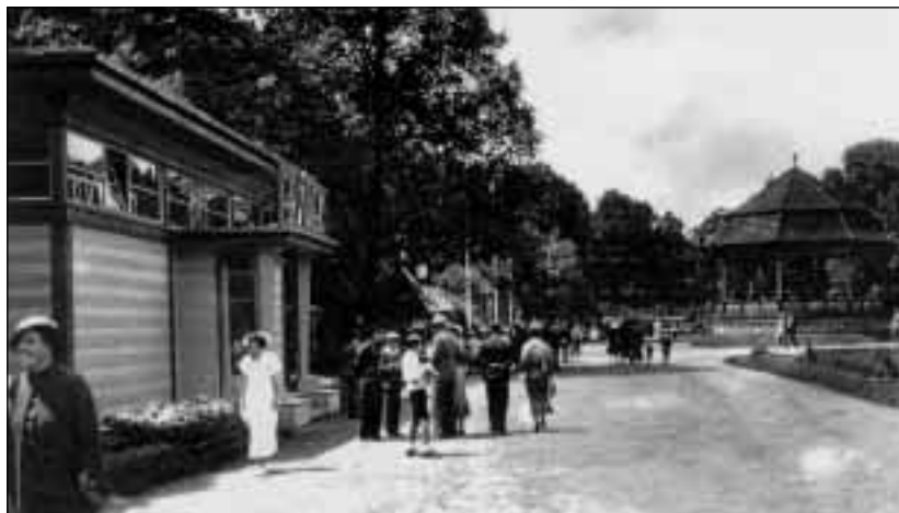
Frýdecká výstava 1935

V rámci Jubilejní výstavy byla uspořádána i řada jedno i vícedenních výstav např. Kočovná výstavka elektrárenského svazu, sokolská výstavka 39leté činnosti, výstavka drobného hospodářského zvířectva. Svě zájezdy a sjezdy zde konali například čs. Socialisté, lidovci, sociální