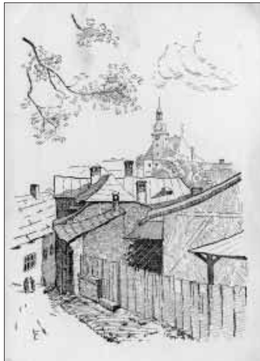
Frýdecký zámek od Mariánského kostela