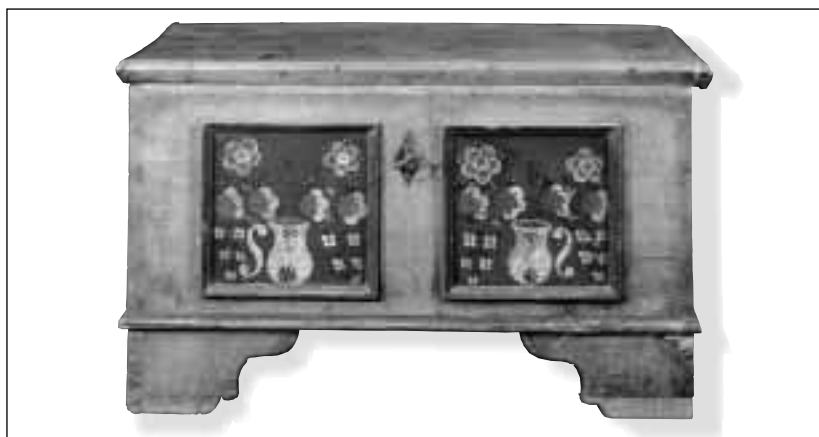
Truhla z přelomu 19. a 20. století, okolí Těšína. Bez základního nátěru, malovaný dekor jen ve dvou čtvercových plochách předního dílu.