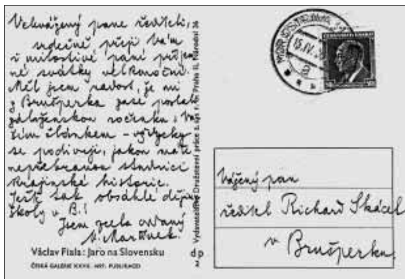
Sbirky Muzea Beskyd Frydek-Místek

život už je takový - a pak historické obrázky „Na křížovatkách, ...“ 14 jejichž první semeno snad bylo vhozeno na brušperské škole ...“