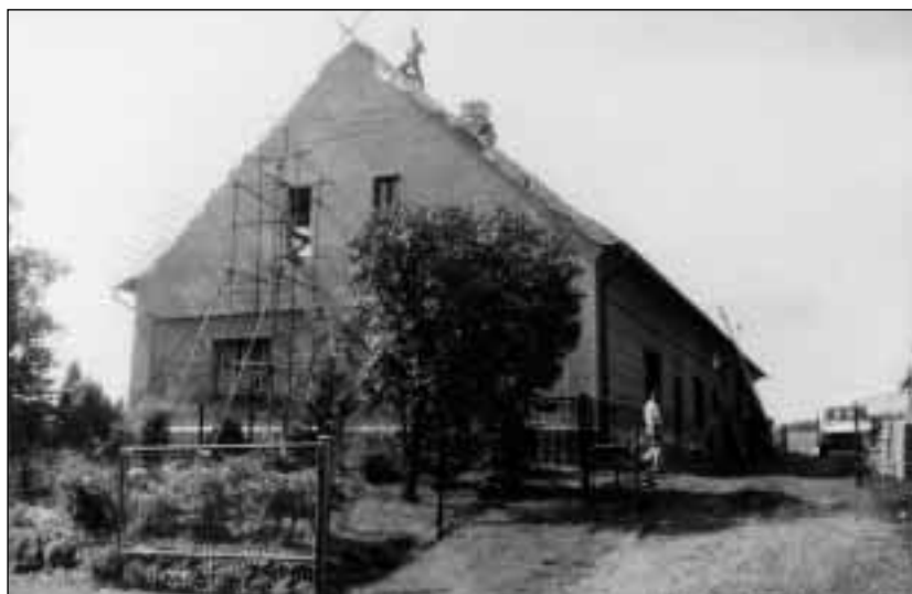
Bruzovice, č. 12, fojtství

V r. 1580 tu bylo 44 osedlých, z toho 12 volných, v r. 1636 38 sedláků, z toho 8 volných vč. fojta a 3 zahradníci, v r. 1664 35 sedláků (z toho 7 volných vč. fojta), 4 zahradníci (z toho 1 volný) a 3 chalupníci, v r. 1770 35 sedláků (z toho 7 volných vč. fojta), 5 zahradníků (z toho 1 volný) a 25 chalupníků (z nich 2 volní). 14