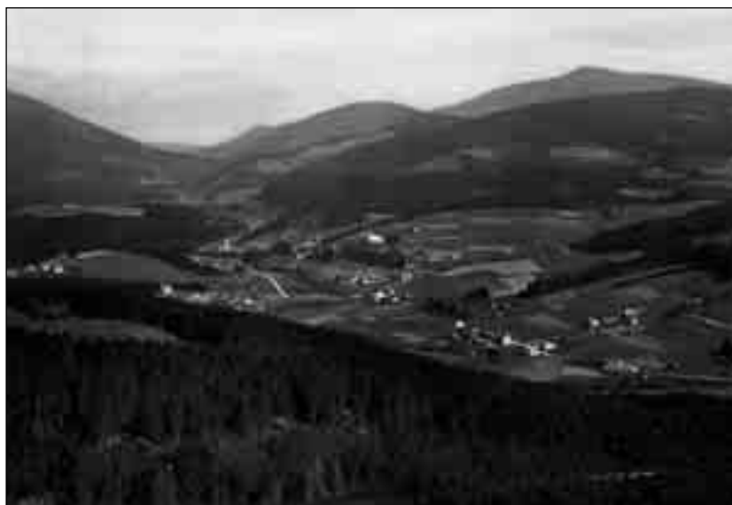
Staré Hamry

mnohá nebezpečí, dokonce i nebezpečí smrti ( pericula mortis ). Navíc musí přecházet často rozvodněnou řeku Ostravici, která strhává lávky i mosty. Z důvodu docházení do Starých Hamer mnohdy ani nestačí navštěvovat nemocné ve vlastní farnosti a nemůže jim udělovat svátosti. Proto žádal místeckého děkana o jmenování kooperátora v Ostravici, který by mu v duchovní službě ulehčil alespoň do doby, než bude ve Starých Hamrech ustanoven samostatný kněz ( sacerdos singularis ). Svůj list Malata uzavřel žádostí o zvýšení dosavadní kongruy z náboženského fondu, což odůvodnil tím, že má mnohem více povinností než ostatní kněží v děkanátu. 8