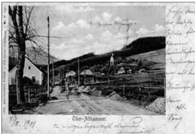
Staré Hamry Sbírka pohlednic Muzea Těšínska

tým méně, že by se vyjmenovanýho pana faráře na nějaký papír byla s křížkem podepsala. Matka ale mi pravila, že ju pan farář ostravický v nedělu před sv. Martinem k sobě povolal a ju v přítomnosti ostravické šenkýřky a rektora chtěl nutit, aby se mu podepsala a jemu dva groše, které za štemplovaný papír dát musel, zaplatila, ona ale že se mu ani podepsat, ani tych dvou groší dát nechtěla. A na to jí ten ostravický pan farář pověděl, že její dcera ne na Borovů, ale k němu do Ostravice jíti musí...“