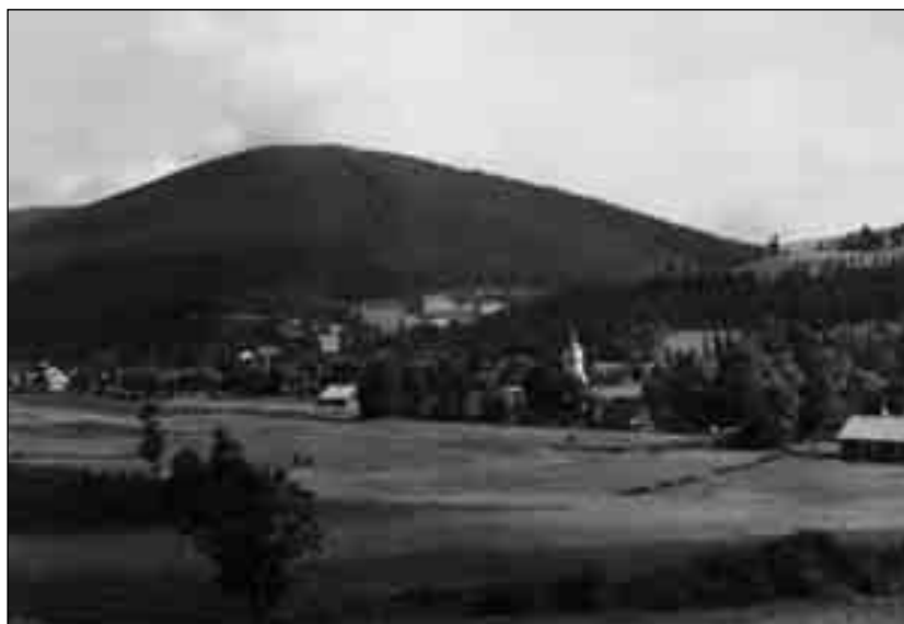
Brenna