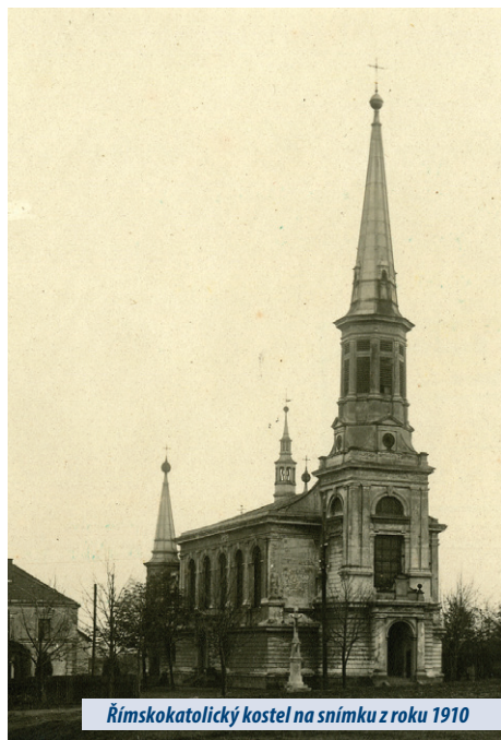
Římskokatolický kostel na snímku z roku 1910

Obec Doubrava bývala po staletí součástí farnosti Orlová. Ta byla již od středověku ve správě řádu benediktinů, výjimkou byla druhá polovina 16. století a první tři desetiletí 17. století, kdy byla farnost evangelickou. Převratné události druhé poloviny 19. století – vznik moderních obcí s volenými orgány, především pak intenzivní industrializace a s ní souvise-