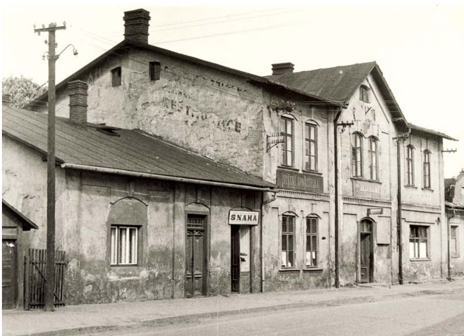
Objekt někdejšího hostince Františka Rybíaře č. p. 40 před demolicí, 60. léta 20. století.