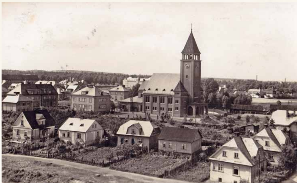
Kostel Na Rozvoji byl původně určen pro německý evangelický sbor a byl postaven v r. 1926. Výstavbu realizovala firma Eugena Fuldy z Českého Těšína.

možná stovek nových obytných domů. Přechod Českého Těšína od dřívější chaotické předměstské těšínské výstavby ve skutečně fungující nové samostatné město byl prostě obdivuhodný. Prezident republiky mohl být spokojen.