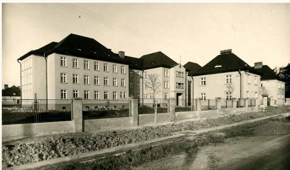
Základní kámen nemocnice byl položen 1. října 1933. Náklady na výstavbu a vnitřní vybavení činily téměř 9 mil. Kč

Když ve dnech 5. a 6. července 1930 navštívil československou část Těšínska prezident republiky Tomáš Garrigue Masaryk, mohl se přesvědčit, zda tomu tak skutečně je. Zastavil se nejprve ve Frýdku a v Třinci a poté dorazil i do Českého Těšína. Města, které mělo za sebou pouhých deset let samostatné existence. Před novou budovou českotěšínské radnice vítali prezidenta úředníci, soudci, vojáci a policisté, nechyběli skauti a žáci českých, polských i německých škol se svými učiteli. A samozřejmě stovky dalších lidí. Budova radnice dokazovala, že výstavba nového města úspěšně pokračuje. Dokazoval to i celý nově otevřený rozsáhlý komplex budov státních úřadů, v němž kromě okresního úřadu našel své sídlo i okresní soud, notariát, prokuratura a československá četnická a policejní stanice. Rychle vyrůstaly nové obrysy bank, obchodů, hotelů a restaurací, dokonce i několika nových kostelů. A také desítek,