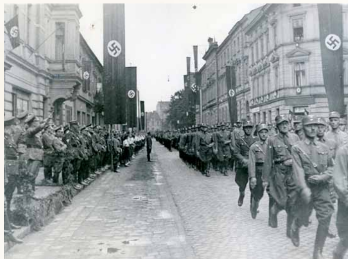
Defilé jednotek SA po Saské Kupě (dnes Hlavní třída) během návštěvy stabsführera Viktora Lutzeho ve městě, 7. června 1942