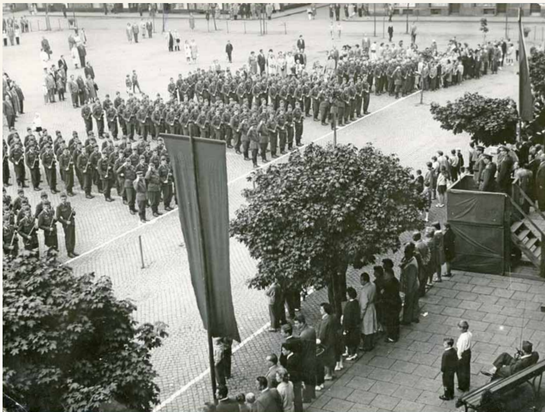
Vojenská přehlídka místní vojenské posádky na náměstí ČSA v rámci oslav 15. výročí osvobození Československa, 9. května 1960

v Masarykových sadech, v níž probíhaly i výslechy. S těmito represivními složkami úzce souvisela soudní správa. V Těšíně působil stanný soud (Standgericht) a zemský soud (Landgericht) podřízený soudu v Katovicích.