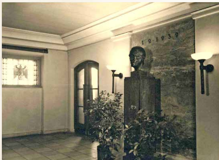
Interiér radnice s bustou Adolfa Hitlera a datem oslavujícím připojení města k Německé říši, kolem r. 1942

v případě Těšína ke spojení těchto správ nedošlo. Ve městě měly svou centrálu kromě okresního vedení NSDAP i další stranické složky – např. motoristický sbor Kraftfahrkorps NSKK, letecký sbor Fliegerkorps NSFK, Hitlerjugend HJ nebo Bund Deutscher Mädel BDM. Těšín byl sídlem dalších široce rozvětvených bezpečnostních složek a soudního aparátu. Nacházela se zde služebna gestapa sídlící v budově dnešního finančního úřadu