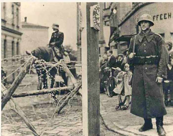
Polský voják pózující u československého hraničního orientačního sloupu před kavárnou Avion 2. října 1938

Po přijetí mnichovské dohody vznesly své nároky na části území Československa i Polsko a Maďarsko. Předmětem zájmu polské zahraniční politiky se stalo území politických okresů Český Těšín a Fryštát označované termínem Záoľší (Zaolzie). Polské územní požadavky vyjádřila nota z 27. září 1938. Pod vlivem neutěšené mezinárodní situace je československá vláda 1. října 1938 přijala. Vlastní obsazování Těšínska začalo v neděli 2. října po druhé hodině odpoledne slavnostním vstupem polských jednotek do Českého Těšína. Odstupování dalšího území probíhalo v šesti úsecích ve dnech 4.–11. října. Ze správního hlediska se území do 24. října nacházelo pod vojenskou správou tzv. Samostatné operační skupiny Slezsko (Samodzielna Grupa Operacyjna