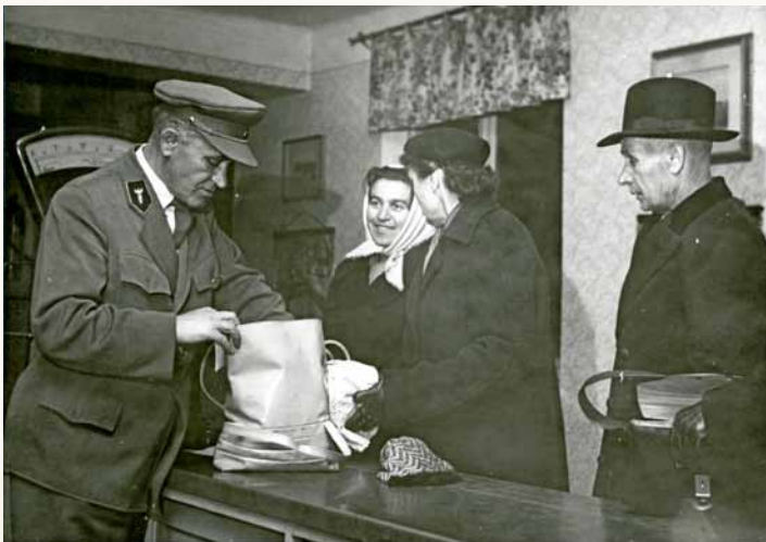
Celní prohlídka na mostě Družby, r. 1960