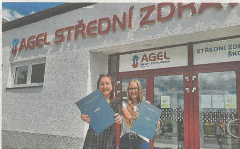
STÁLE ROSTOUCÍ ZÁJEM O ZDRAVOTNICKÉ OBORY ZAZNAMENÁVÁ AGEL STŘEDNÍ ZDRAVOTNICKÁ ŠKOLA A VYŠŠÍ ODBORNÁ ŠKOLA ZDRAVOTNICKÁ, KTERÁ PŮSOBÍ V OSTRAVĚ, ČESKÉM TĚŠÍNĚ A PŘEROVĚ.

Velkou motivací pro všechny studenty a kurzisty AGEL SZŠ a VOŠZ je doplnění nebo zvýšení kvalifikace, zvýšení samostatnosti při výkonu povolání, změna oboru nebo jistota budoucího zaměstnání. „Moc nás těší zájem ze strany veřejnosti. Jsme rádi, že přichází právě k nám, aby si doplnili či rozšířili své vzdělání. Během šesti let jsme předali osvědčení