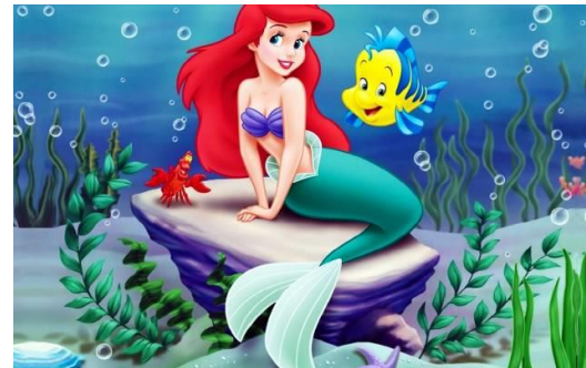
MALÁ MOŘSKÁ VÍLA